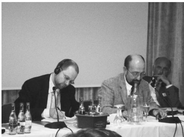
Владимир Орлов и Харальд Мюллер

Что касается Ирана, то он, по мнению МЮЛЛЕРА , осуществляет две ядерных программы. Гражданскую программу сначала поддержала Германия, а затем Россия. С 1985 года Иран ведет необъявленные работы по обогащению и переработке ядерного топлива, их секретный характер является нарушением верификационного соглашения. После их выявления в 2002 году Иран, к тому же, весьма неохотно делился информацией. Так что до сих пор существуют сомнения в том, вся ли информация была открыта. Иран расположен в конфликтном регионе, и опыт взаимоотношений Ирана с США никак не назовешь позитивным: там еще свежи воспоминания о скрытых интервенциях, изоляции, несанкционированных нападениях и т.д. Поэтому военные круги склоняются к необходимости эффективного устрашения.